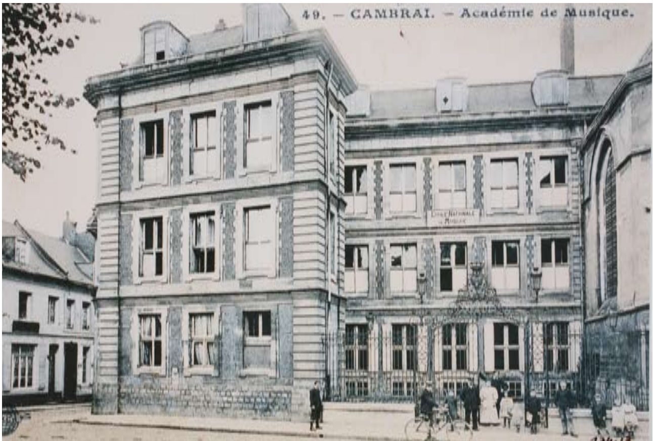
4 L' Académie de Musique de Cambrai vers 1920 (fondée en 1822)

Le Conservatoire à Rayonnement Départemental et le Théâtre aujourd'hui, un pôle de formation et de diffusion artistiques au coeur de la ville.