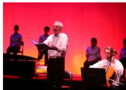
Concert «Hommage à Pinter» Musique de Chambre et Théâtre

Généralement programmés de Janvier à Juin, les Concerts « jeunes » et Représentations « théâtre » sont pour les musiciens et les comédiens des moments de plaisir et de partage, durant lesquels ils sont placés dans des conditions professionnelles. Durant la dernière semaine du mois de Juin, après la « Fête de la Musique » largement exprimée par les divers groupes classiques ou de Musiques « actuelles », c'est sur la grande scène du Théâtre Municipal que l'occasion est donnée aux diverses formations, vocales, orchestrales et théâtrales, de conclure l'année scolaire par un véritable festival des activités de pratique collective étalé sur huit jours.