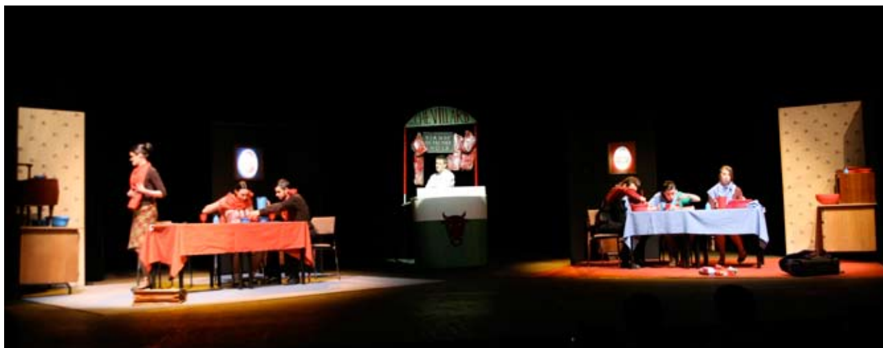
«Les Mandibules» de Calaferte par l'Atelier de réalisation de la classe d'Art Dramatique