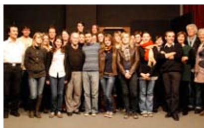
René de Obaldia